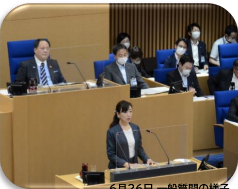
6月26日 一般質問の様子