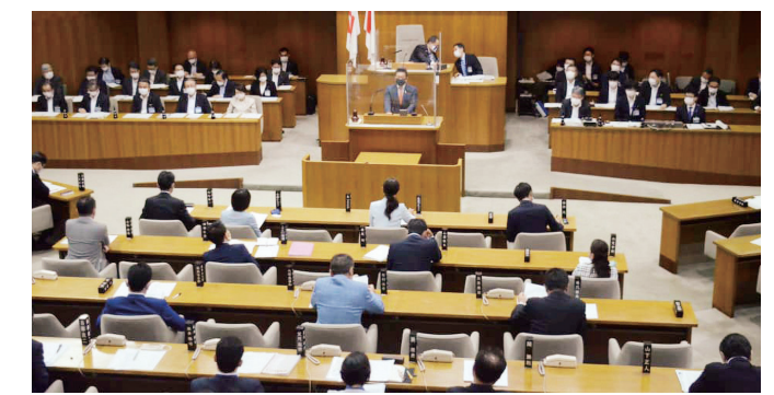
ソーシャルディスタンスを確保するため半数の議員が議場から退出し質疑は控室で傍聴。採決のみ全員出席しました。

今臨時会(5月12日から15日まで開催)では新型コロナウイルス感染症への対策として、医療機関への助成や、PCR検査検体採取場の設置、市立学校における1人1台のタブレット端末の整備事業などの感染拡大防止対策と医療提供体制の整備事業に145億円、特別定額給付金や子育て世帯への臨時特別給付金の給付事業、生活困窮者への住居確保給付金など市民生活の支援事業に3845億円、中小企業制度融資や商店街の支援など企業・事業活動の支援事業に計上された1752億円の補正予算について採決が行われ、全会一致で可決しました。補正額は過去最大規模の5743億6700万円となりました。